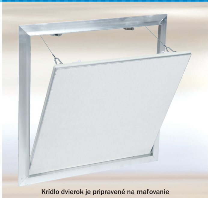
Krídlo dverok je pripravené na maľovanie